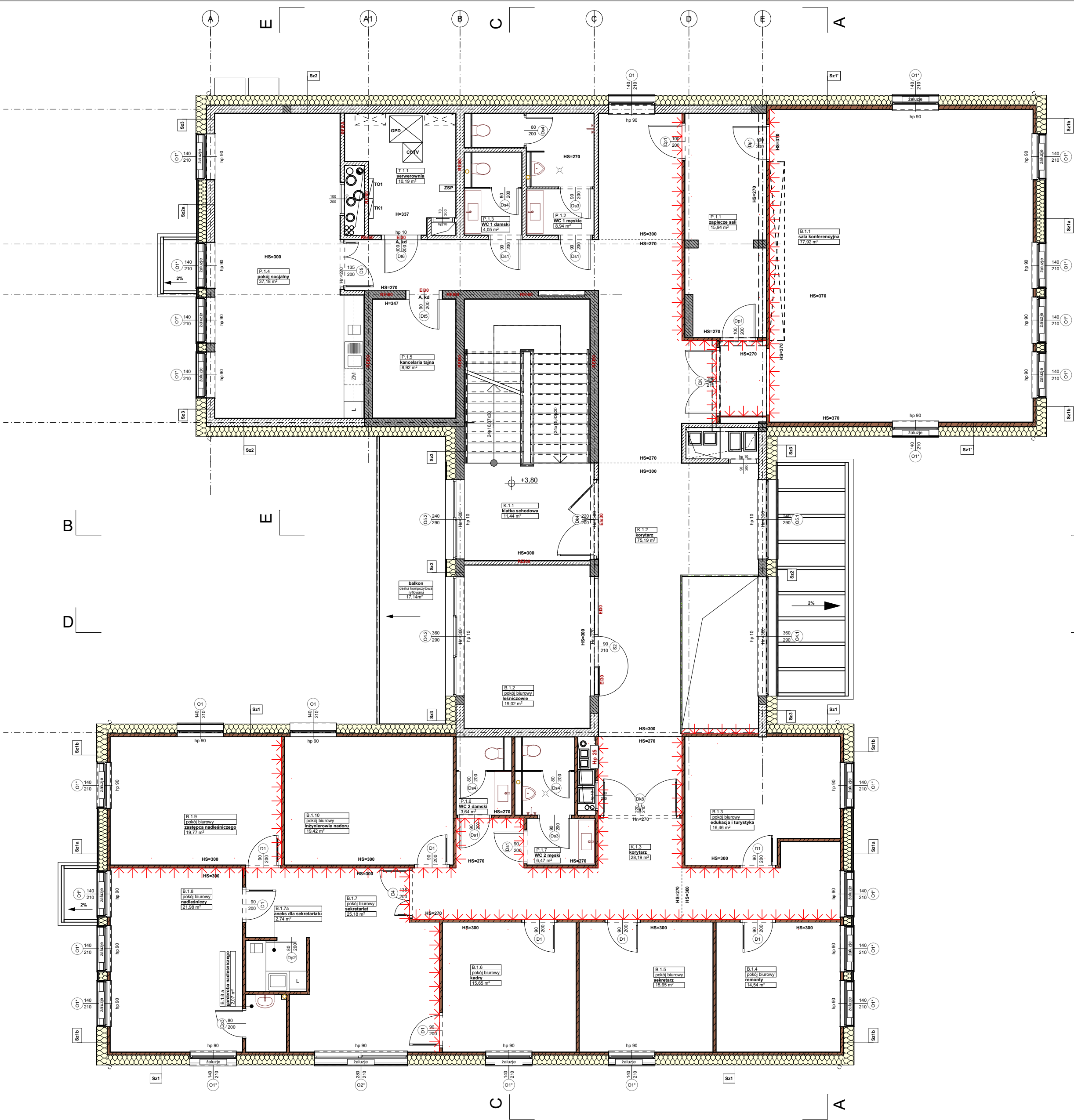
1. Piętro 1-ściany z CLT, jakość wykończenia 1:100